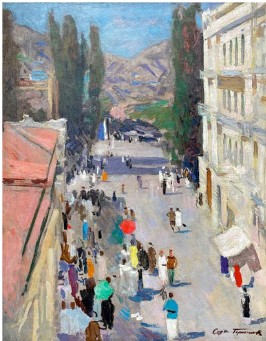
С.В. Герасимов. Кисловодск. 1938. Частное собрание.

Став символами "национального" в русском пейзаже, произведения художников-пейзажистов отправились на страницы книги для чтения для младших классов "Родной речи", название которой в настоящее время воспринимается многими с определенной долей иронии, через призму прошлого, с налетом ностальгии и сентиментальности, мысленно возвращая в детство, к первому знакомству с картинами великих русских художников из собраний Третьяковской галереи и Русского музея.