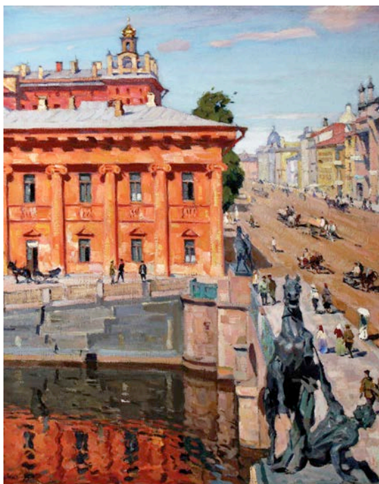
А.Б. Лаховский. Невский проспект. Вид от Аничкова моста. 1920. Частное собрание.