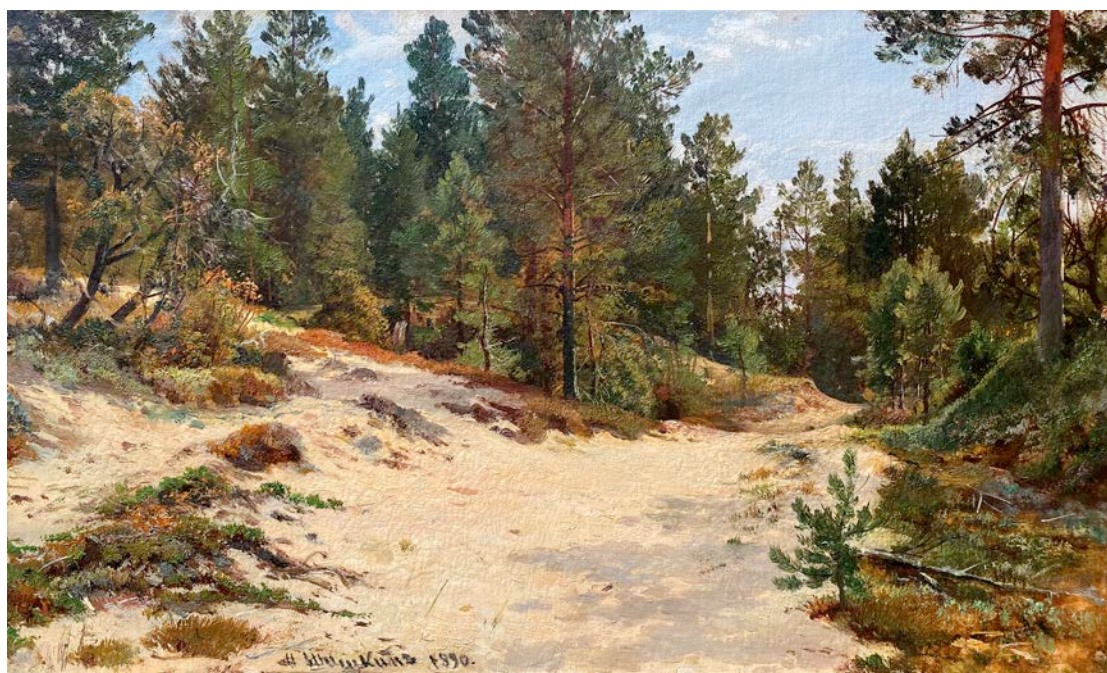
И.И. Шишкин. Сосны в Мери-Хови. 1890. Частное собрание.

Обращение к "национальному" в пейзаже стало важным шагом на пути к становлению реалистического художественного метода, который в наибольшей мере проявился во второй половине XIX века и был связан с деятельностью Товарищества передвижных художественных выставок – настоящих революционеров своего времени. Отказ от академической и романтической идеализации ландшафта в живописи привел к укреплению позиций реализма, развитию практики пленэра и этюда. Художники обратились к природе как к лучшему и совершенному учителю. Но тем не менее, при этом находили свой собственный путь для передачи тех или иных состояний природы или же идеологических посылов через изображение пейзажа. Так Иван Шишкин сосредоточился на создании эпических пейзажей, проникнутых национальной гордостью, а Алексей Саврасов и, позже, его ученик Исаак Левитан – на "пейзаже настроения", создании философских пейзажей, полных мистической глубины – на собирательном образе русской природы, лишая пейзажи иллюстративности, превращая живопись в поэзию. "Поэзия живописи" позже станет основной характеристикой творчества Левитана. Он обогатит этот "словарь" меланхолией, игрой света, поиском божественного начала в самой незначительной детали.