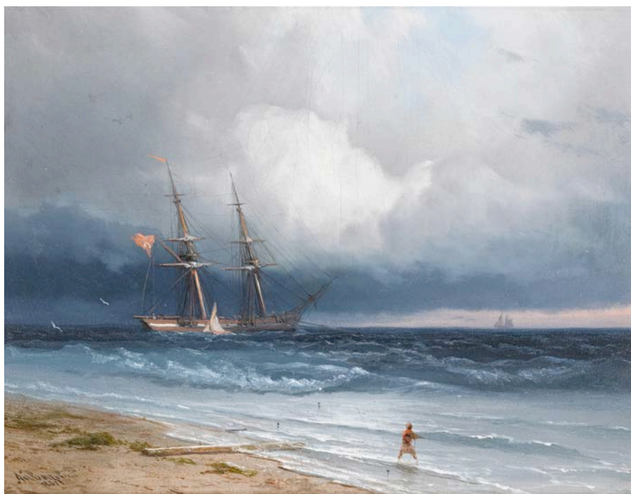
И.К. Айвазовский. Морской пейзаж. 1861. Частное собрание.

Чуть позже русская пейзажная живопись ушла в русло романтизма, эта тенденция сохранилась вплоть до конца XIX века. Художники перестали охотиться за лучшими и репрезентативными видами и начали обращать внимание на смену времен года, особенности освещения в разное время суток. Так, выдающийся маринист Иван Айвазовский создал целый каталог-энциклопедию состояний морской стихии. А Алексей Боголюбов, сохраняя верность видовой перспективной живописи, не допускал преувеличений в изображении природы ради большей эффектности, что было свойственно его старшему коллеге. Он именовал себя натуралистом, а Айвазовского – идеалистом, всячески подчеркивая разницу в подходе к изображению морского пейзажа.